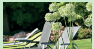
Für die Seele